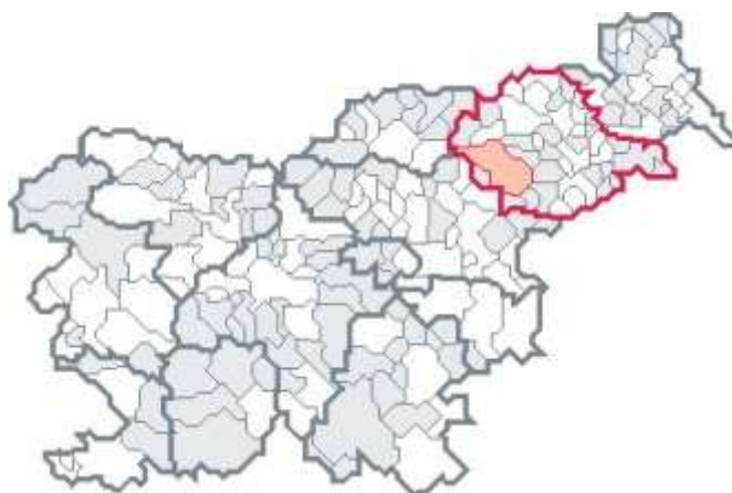
Slika 3-1: Podravska regija z občino Slovenska Bistrica

Koncentracija gospodarskih dejavnosti in prebivalstva na nekaterih območjih sta v preteklosti povzročila različne pogoje za življenje in delo (razlike v prostorski razporeditvi delovnih mest, stopnji brezposelnosti, v izobrazbeni strukturi prebivalstva), neustrezno prometno povezanost in neenakomerno dostopnost. Problemi so še posebej izraziti v strukturno zaostalih in ekonomsko-razvojno šibkih območjih s pretežno agrarno usmeritvijo, v območjih z demografskimi problemi, z nizkim dohodkom na prebivalca ter v ekonomsko in socialno nestabilnih območjih.